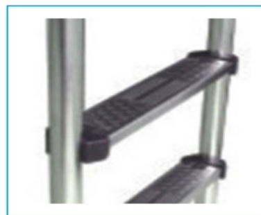
Stainless steel pedal