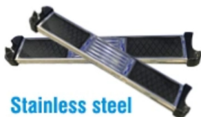
Stainless steel anti-slip pedal