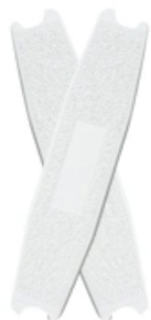
FRP plastic footboard